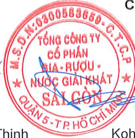
Koh Poh Tiong